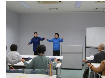
手話歌(ひとりの手)