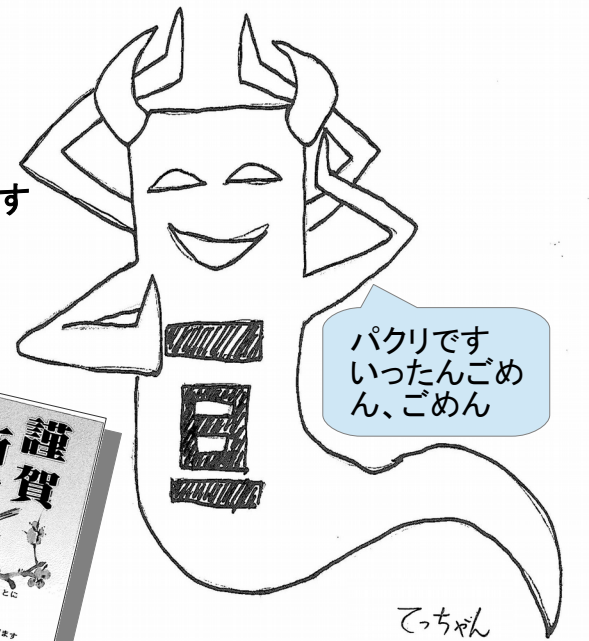
妖怪ウォッチ「一旦ゴメン」