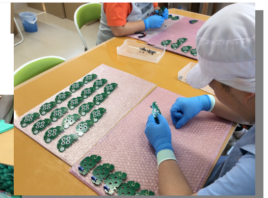
電子部品の組立作業