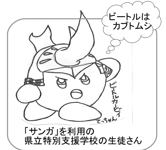
「サンガ」を利用の 県立特別支援学校の生徒さん

唐津市では社会福祉協議会に事務所を置く、唐津市ボランティア連絡協議会が中心になり会員はもちろん、市内の中高等学校、福祉作業所、高齢者通所施設に当日の募金活動の依頼がありました。8月23日日曜日午前中に商業施設など市内12箇所募金活動が行なわれました。