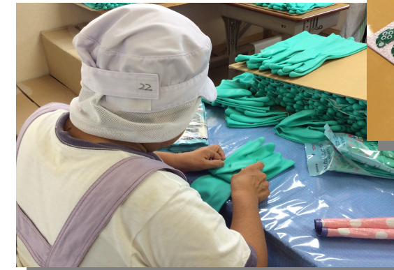
ゴム手袋の袋詰作業