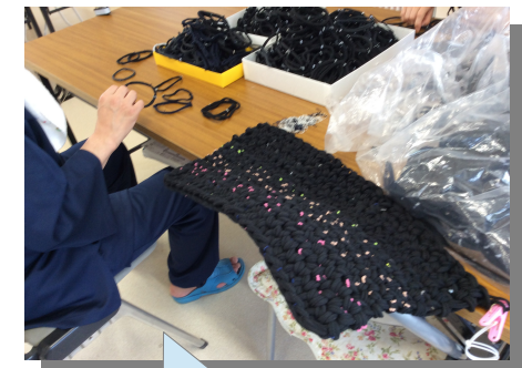
リハビリを兼ねて足拭きマット作成中