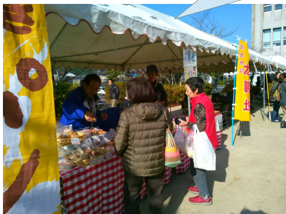
クッキーやパン、切り花などの販売がありました。