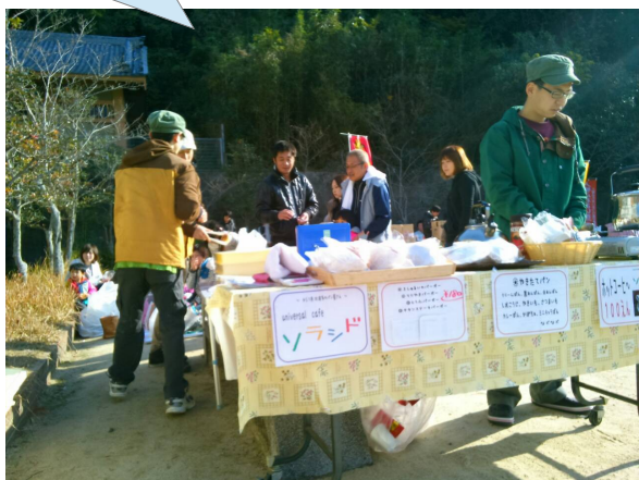
コーヒーとパンの販売がありました。