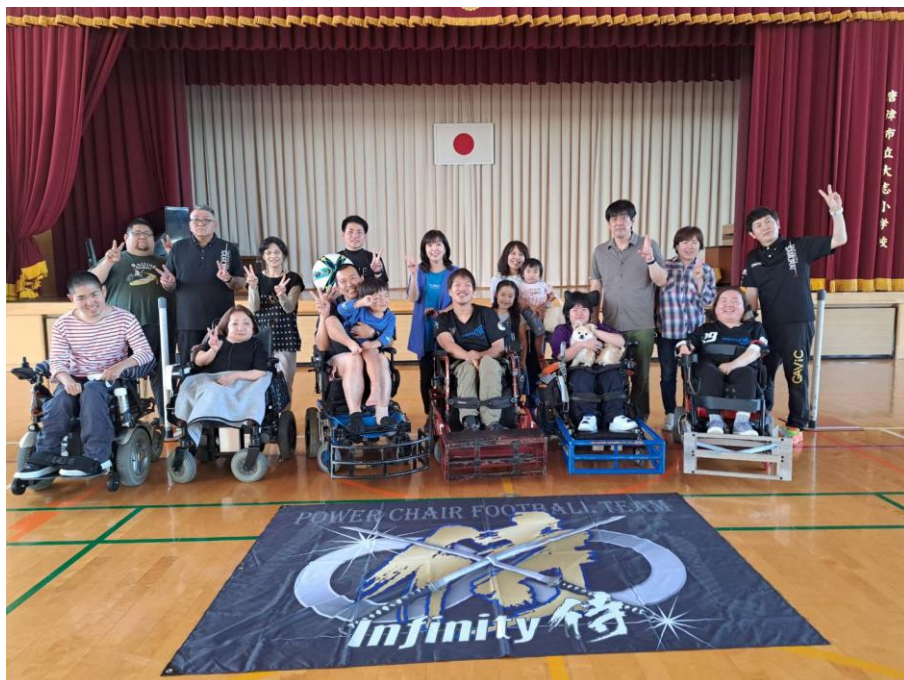
↑ 参加者全員で集合写真 笑顔いっぱい！(^0^)！