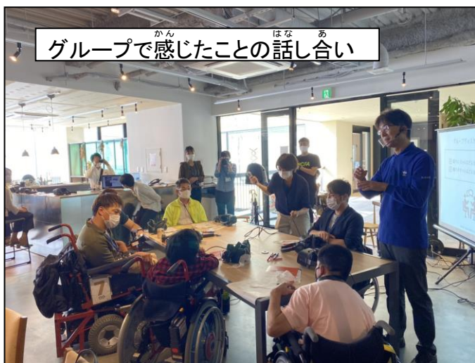
グループで感じたことの話し合い