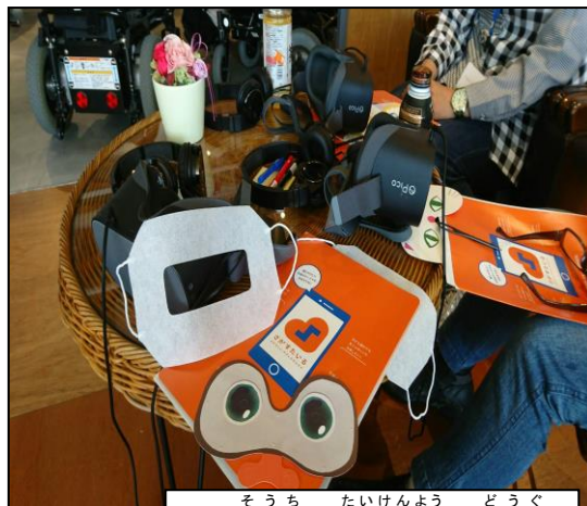
VR装置や体験用の道具