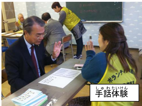
しゅわたいけん 手話体験