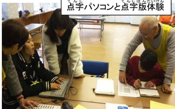
てんじ 点字パソコンと点字版体験