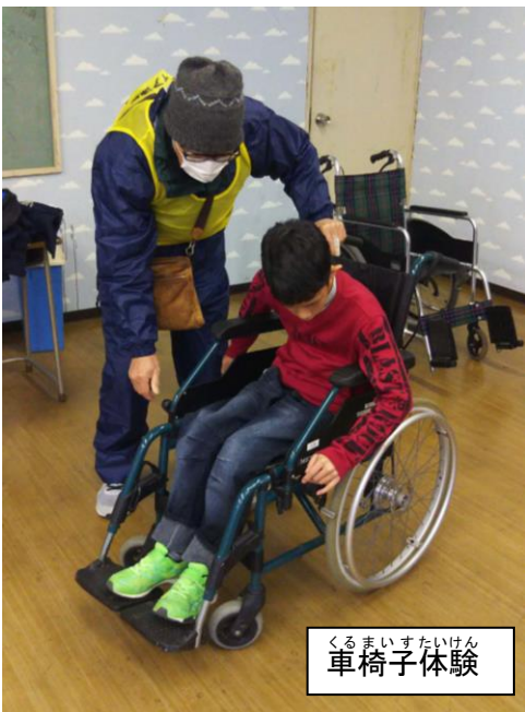
くるまいすたいけん 車椅子体験

がつ にちにちようび やはた 12月8日曜日に八幡 まちにあるじんけん ター唐津にて「人権ふれあ まつり」がかいさい 開催されました。