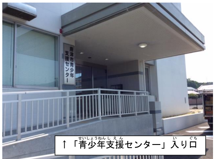
↑ 「青少年支援センター」入り口