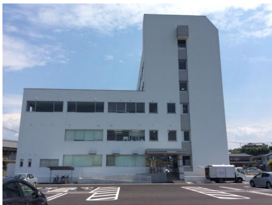
↑ ↓ 「青少年支援センター」の外観