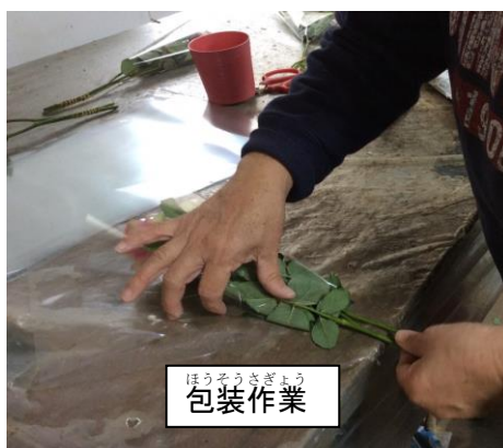
ほうそうさぎょう 包装作業