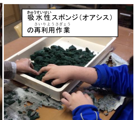
きゅうすいせい 吸水性スポンジ(オアシス) さいりょうさぎょう の再利用作業