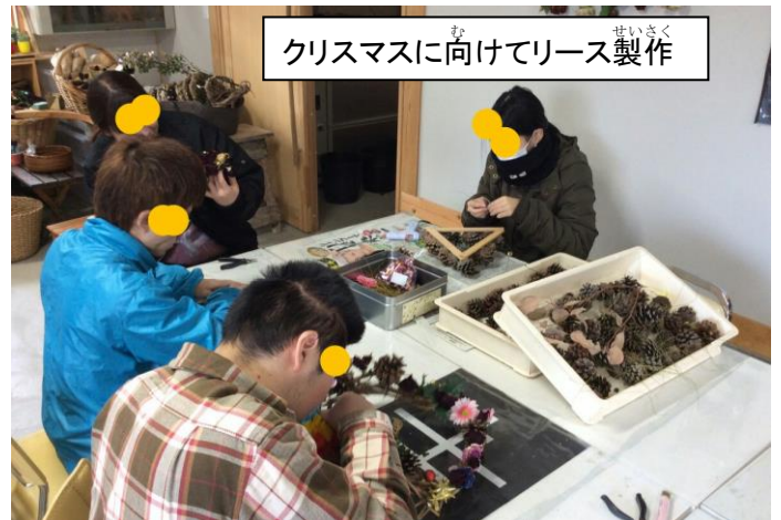
クリスマスに向けてリース製作

作業の内容は花が中心です。バラの花の栽培や加工（フラワーアレンジメント・ブリザーブドフラワーなど）を支援員とともに行います。すべての過程を一人で行うのではなく、ひとりひとりに合った作業をおこない、互いに協力し合って1つのものを作り上げます。