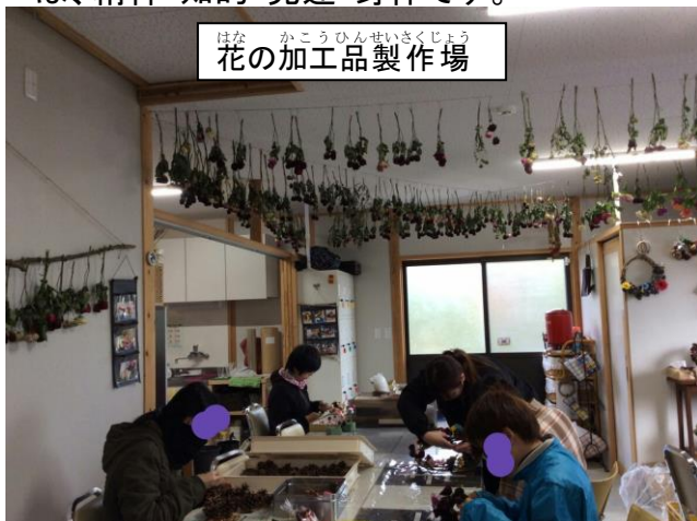
はな かこうひんせいさくじょう 花の加工品製作場