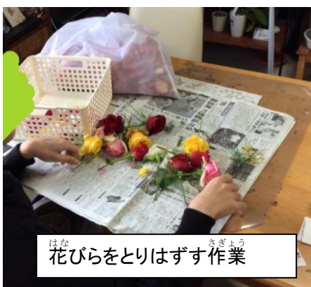
はな 花びらをとりはずす作業

「ohanaおはな」が地域に受け入れられ、地域とともに「ohanaおはな」がますます大きく広がっていくのを感じました。そして、個々の可能性を発見し、明るい将来に導いていく熱い思いを感じた取材でした。