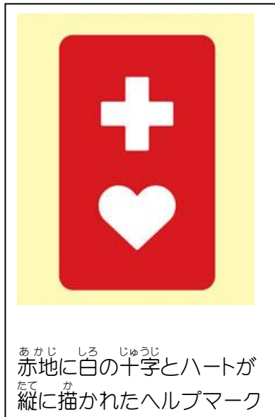
赤地に白の十字とハートが 縦に描かれたヘルプマーク

スを受けることがあり、こういった人たちの声を集めてヘルプ マークがつけられました。